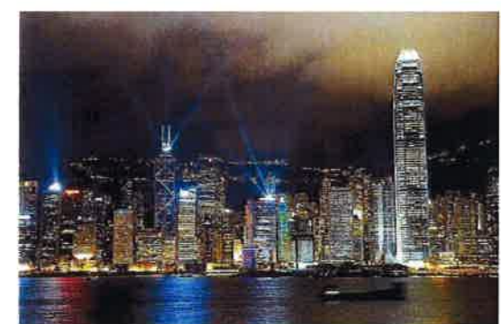
シンフォニー・オブ・ライツ 20時より毎晩13分間、100万ドルのビクトリアハーバーの夜: 香港島、九龍半島の主要な高層ビルから放たれる色とりどり レーザーが加わり、観光客を魅了しています