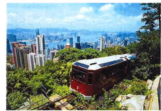
ビクトリアピークより見た香港市内