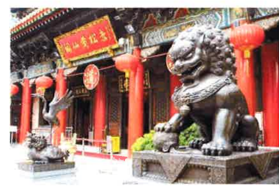
パワースポットで有名な、黄山仙