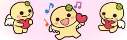
シンボルキャラクター こころちゃん