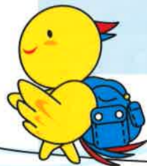
防災マスコットはぼタン

1月17日は「ひょうご安全の日」 1月は「減災月間」 毎月17日は「減災活動の日」